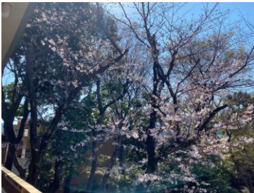
園庭の桜がきれいに咲きました