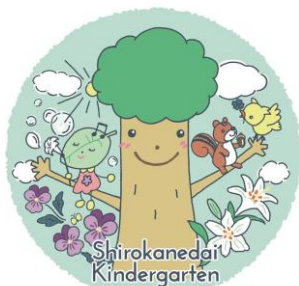
白金台幼稚園のマスコット 「はっぴー」と「もりりん」です